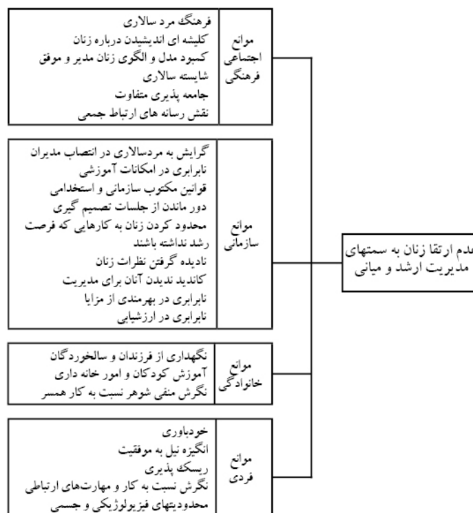
شکل ۱ مدل شماتیک موانع ارتقا زنان به سمت‌های مدیریت میانی و ارشد

ویژه در دوره‌هایی خاص از چرخه‌ی زندگی کاری می‌شود (سیدان و خلیفه‌لو، ۱۳۸۷). هم‌چنین، مسئولیت‌های خانوادگی، مادری و همسری موجب بروز نگرش منفی نسبت به توانایی زنان می‌شود. این مسأله که از زن انتظار می‌رود، تمایلات و تعهدات کاری را طوری تنظیم و تعدیل کند که با کاستن از تقاضاهای کاری بتواند تقاضاهای خانواده را برآورده سازد، در نگرش مدیران تأثیر منفی داشته است (زمانی، ۱۳۸۸). مجموعه قوانین و مقررات مکتوب سازمانی، عدم برابری در فرصت‌های رشد، آموزش و نابرابری در ارزیابی‌ها و پرداخت‌های مالی و استفاده از مزایا، فرهنگ مردسالارانه محیط کاری و نادیده نگاشتن زنان در سازمانها نیز عواملی است که تحت موانع سازمانی، زنان را از تصدی سمت‌های مدیریتی بازمی‌دارد (کوپر جکسون ۲۷ ، ۲۰۰۱).